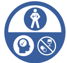
APTITUDE AU TRAVAIL