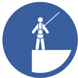
TRAVAIL EN HAUTEUR