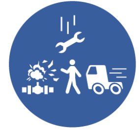
LIGNE DE TIR