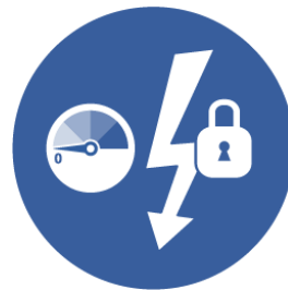
ISOLATION DES SOURCES D'ÉNERGIE