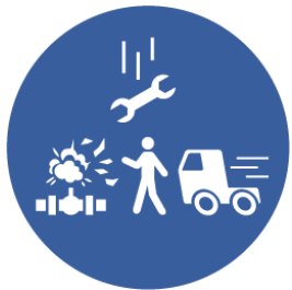
LIGNE DE TIR