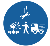
LIGNE DE TIR