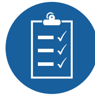
AUTORISATION DE TRAVAIL