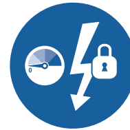
ISOLATION DES SOURCES D'ÉNERGIE