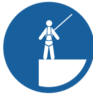
TRAVAIL EN HAUTEUR