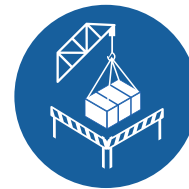
LEVAGE MÉCANIQUE SÉCURITAIRE