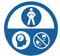
APTITUDE AU TRAVAIL