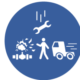
LIGNE DE TIR