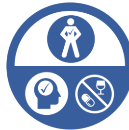
APTITUDE AU TRAVAIL